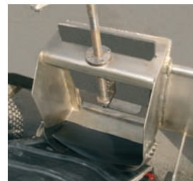
Compuerta para el vaciado de la tolva.